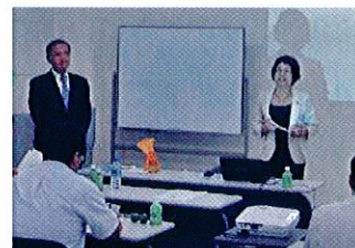
社福塾アドバンスコース

好評いただいた社会福祉法人経営者塾初級編のアドバンスコースとして社福の管理者に求められる ①事業革新 ②自己変革 ③夢創造のスキルアップをめざし、参加型(個人スキル向上とメンターグループ活用目的)で行っています。